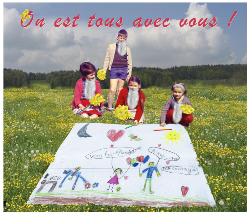
Illustration de Plonk & Replonk diffusée dans Arclnfo pour soutenir l'action «Dessiner pour les aîné-e-s»