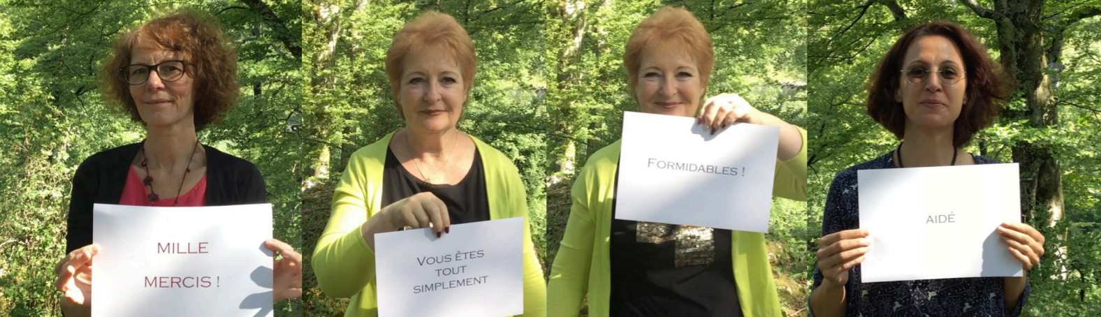
Vidéo diffusée début juin sur Facebook